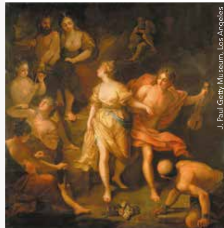
J. Paul Getty Museum, Los Angeles

Réservations obligatoires sur l'application MaVilleFacile