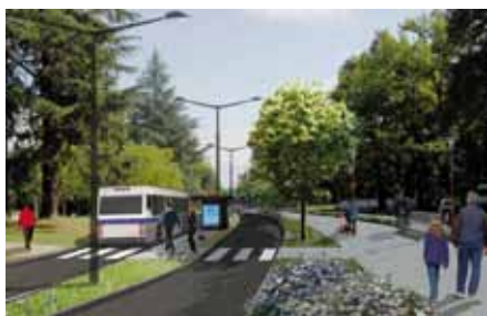
Une simulation parmi 4 propositions pour le cours Lyautey

Dès septembre, les habitants de l'agglomération disposeront d'un réseau de bus plus simple, plus efficace. Une première étape avant la création d'une première ligne de transport en site propre (TCSP), soumise à la concertation depuis le 3 février dernier.