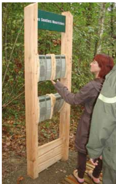
Découvrir les sentiers nourriciers