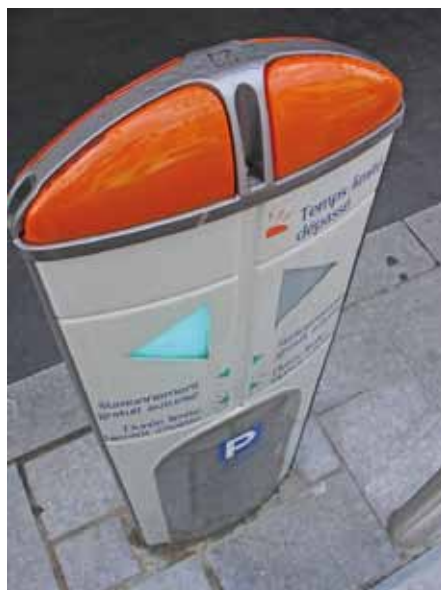
15 minutes de stationnement gratuit

Essayez, vous verrez, cela marche et c'est très pratique !