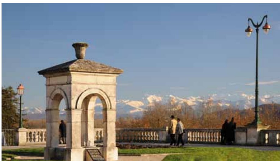
Les horizons palois, vue classée en cours de reconquête

Entre des spécimens malades et ceux qui ont pris des libertés, certains obstruant pour ainsi dire totalement la vue sur les Pyrénées, la Ville de Pau a entrepris une nécessaire campagne d'élagage pour rendre au boulevard ses horizons palois.