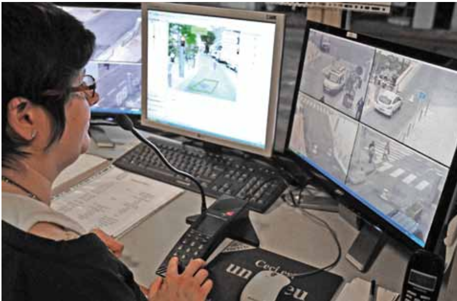
Le poste de vidéo surveillance d'accès au centre piéton

L'hypercentre de Pau régi par des bornes électroniques est réservé prioritairement aux piétons. Il demeure accessible aux voitures et aux deux roues.