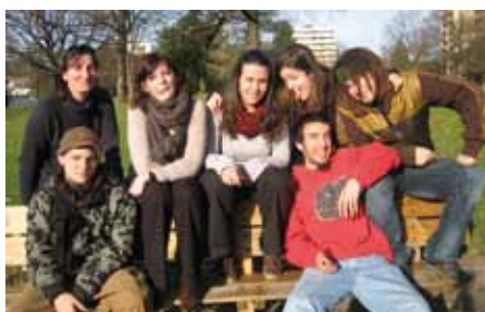
Les volontaires de l'équipe « Ethikanou »

Depuis le mois d'octobre, 29 volontaires réalisent leur service civil à Pau pour une durée de 6 à 9 mois consacrée à des actions d'intérêt général auprès d'associations locales grâce à Unis-Cité.