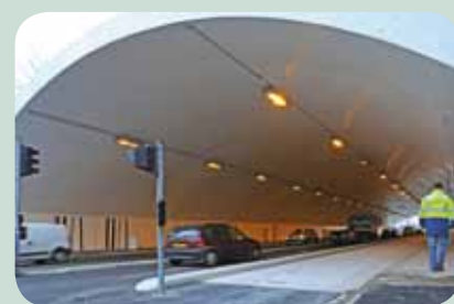
Depuis le 1 er février les Tunnel et Pont d'Espagne sont rouverts à la circulation dans les 2 sens après 5 mois de travaux.