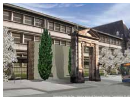
La « Porte de marbre » reconfigurée