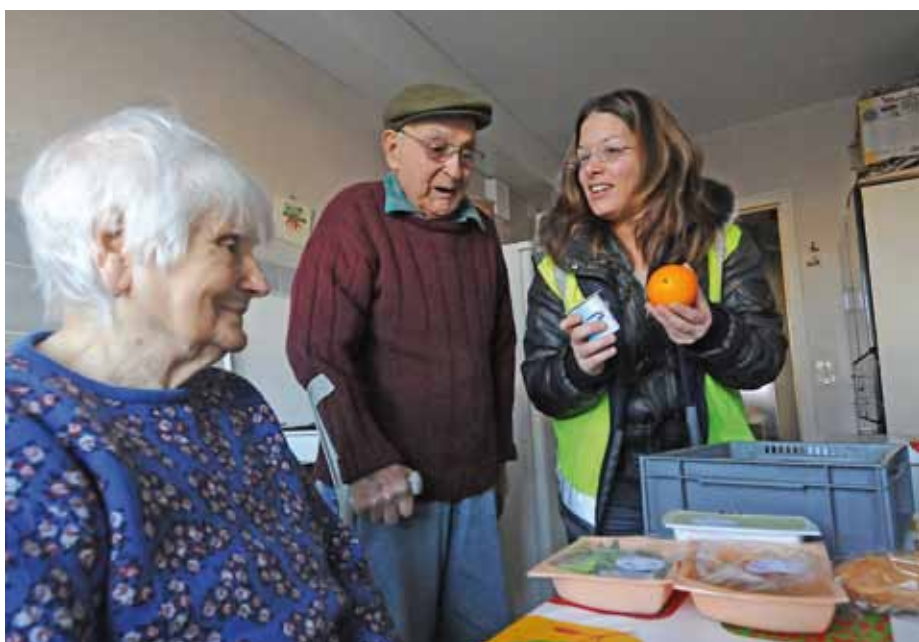
Un lien social indispensable

Depuis le 1 er décembre 2009, les repas livrés au domicile des personnes âgées et handicapées sont de nouveau confectionnés par la cuisine communautaire.