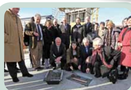
Pose de la 1 ère pierre de la MIDR en présence de Martine Lignières-Cassou Présidente de la Communauté d'Agglomération de Pau-Pyrénées, d'Alain Rousset Président de la Région et de nombreuses personnalités.