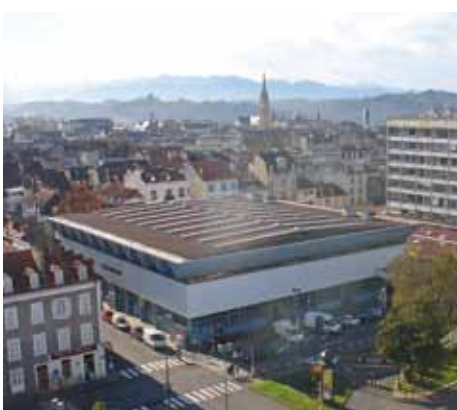
L'aménagement des Halles : un projet de revitalisation du centre-ville

née un nouveau plan de circulation cohérent. Des moyens conséquents seront consacrés à la rénovation du funiculaire, des parkings (peinture, éclairage, signalétique, accueil deux roues, etc.). La mise en place d'un nouveau réseau de bus et la mise en circulation d'une navette électrique en centre-ville qui desservira les parkings Beaumont, Bosquet, Halles-République et Verdun.