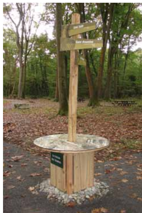
La croisée des chemins