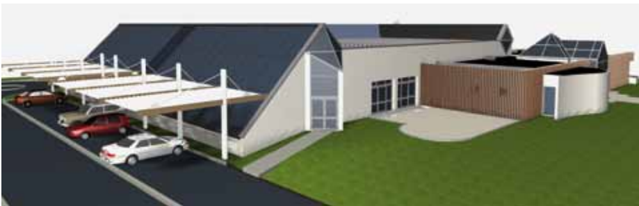
Le projet de la piscine Péguilhan

Par ailleurs, à l'heure où nous bouclons le magazine, deux sites sont encore en lice pour la création du futur stade nautique.