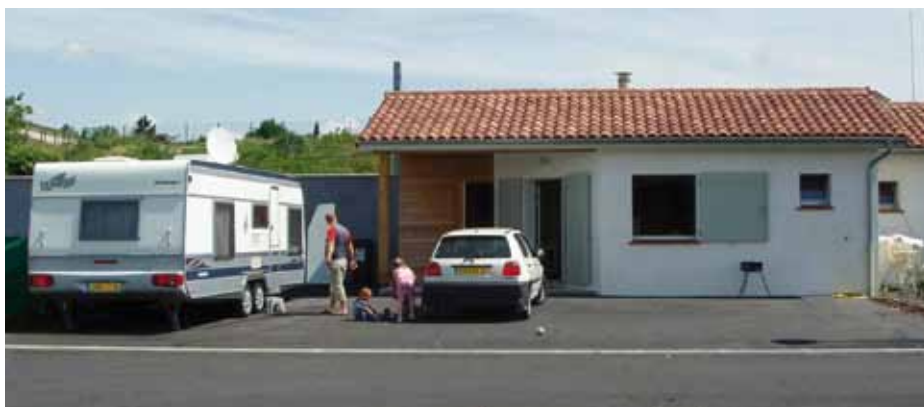
Une expérience concluante à Orthez, lotissement « Les Aigrettes »