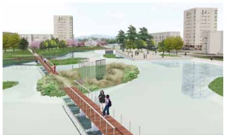
Le projet de parc urbain du Hameau

L'embellissement de l'espace public se traduit quant à lui par la mise en chantier d'opérations d'envergure. Parmi celles-ci, l'aménagement de l'entrée Est de Pau et du secteur Joffre (avec la piétonnisation de la rue Lamothe, l'aménagement de l'axe Daran-Gambetta et de la place Saint Louis de Gonzague, la requalification des places de la République, Marguerite Laborde et du plateau piétonnier de la rue Carnot entre les Halles et le Foirail, l'instauration