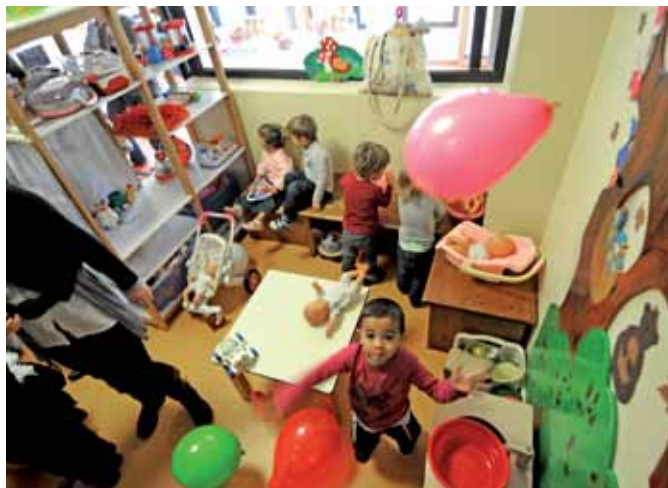
La crèche Saint-Vincent de Pau a été rénovée

Modification des cloisons, réfection des sols, des peintures, changements de menuiseries... La bâtisse centenaire a subi une rénovation de fond en comble pour mieux accueillir les bouts