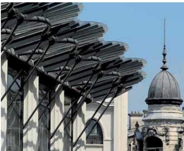
Du Palais des Pyrénées à la Place Clemenceau, une ville à l'architecture moderne, art déco et historique.

Office de tourisme de Pau : 05 59 27 27 08 www.tourismepau.com www.pau.fr