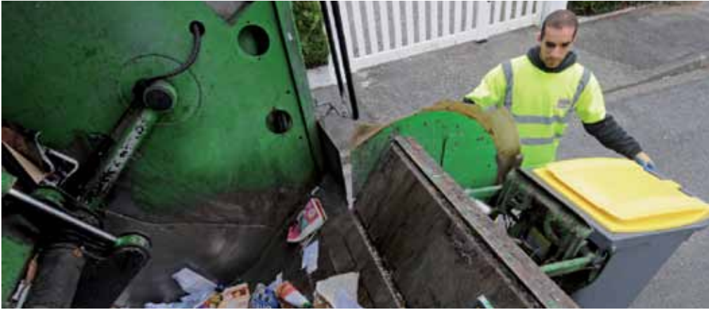
Un nouveau mode de collecte des déchets plus adapté aux pratiques des usagers.