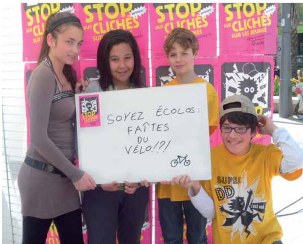
Les jeunes élus ont participé à la semaine du développement durable en avril dernier.

D'une collaboration avec Gare Urbaine, pour l'écriture et la mise en musique, à la conception et au tournage du clip avec l'appui de la web TV Pau Porte des Pyrénées, il n'y avait plus qu'un pas. Un pas désormais franchi, puisque la vidéo est diffusée sur Internet via Dailymotion et pau.fr. « Tous au transport en commun et tout ira bien », le leitmotiv nous invite à re-