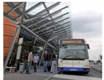
Êtes-vous plutôt bus ou auto ?

Syndicat mixte des transports urbains Pau Porte des Pyrénées, Hôtel de France, 2 bis, place Royale, BP 547, 64 000 Pau. Tél. : 05 59 11 50 50. Centre Re-sources, place d'Espagne, 64 000 Pau. Tél. : 05 59 82 58 60