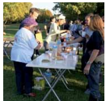
Moment de convivialité partagée.

Les seize meilleures équipes participantes se sont vues récompenser par de nombreux lots et coupes.