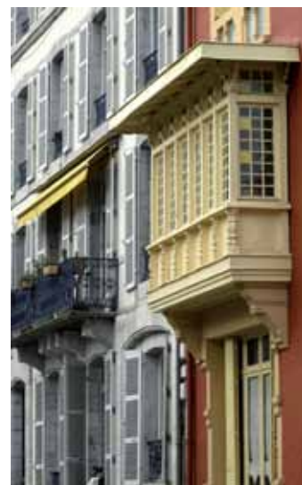
Un ravalement souvent nécessaire.

Le centre Re-sources renseigne et aide les propriétaires à constituer leur dossier. Tél. 05 59 82 58 60.