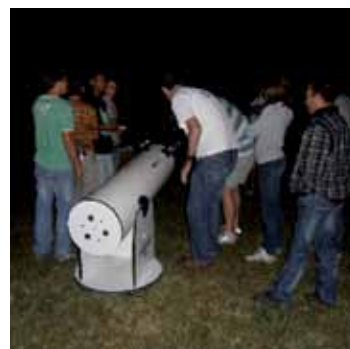
Les participants ont fêté la nuit noire.

Ces rendez-vous sont annoncés aux habitants via le journal « Le Trait d'Union », réalisé par le conseil de quartier, ainsi que par des affiches apposées chez les commerçants du quartier.