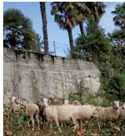
Les brebis symbole du retour de la nature en ville.

co-élaborées en concertation entre les élus, les agents de la collectivité, les acteurs du territoire et les habitants ont été enrichies d'un questionnaire adressé à plus de 1000 foyers. Cinq défis ont servi de support à l'élaboration de ce programme : permettre à chaque habitant d'être acteur ; promouvoir des modes de production et de consommation responsables ; lutter et s'adapter au changement climatique ; créer les conditions d'un mieux-vivre ensemble et concilier nature et développement urbain. Un dispositif de suivi et d'évaluation sera mis en place prochainement.