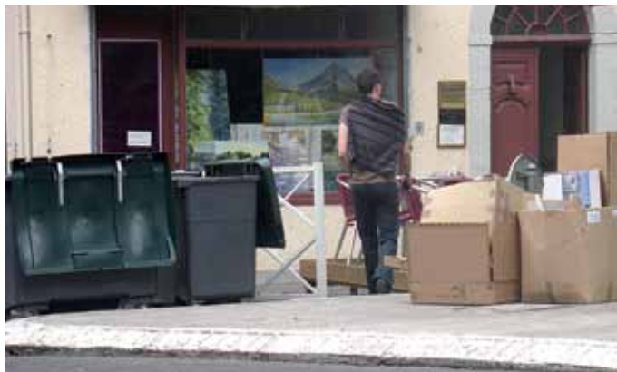
C'est le petit geste de chacun qui fait une ville propre.

La Ville de Pau adhère à l'association des villes pour la propreté urbaine (AVPU). Une centaine d'agents travaille sur le terrain pour rendre la cité royale toujours plus propre.