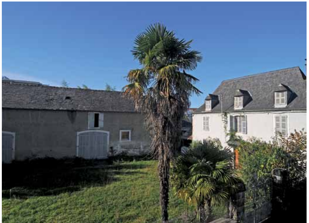
La rénovation de la ferme alliera respect du patrimoine et de l'environnement.

Aussi, le recours aux matériaux naturels (chanvre, chaux, bois) et les économies d'énergie seront privilégiés. Par exemple, par le choix d'une chaudière à granulés avec un complément solaire ou différentes solutions techniques (ma-