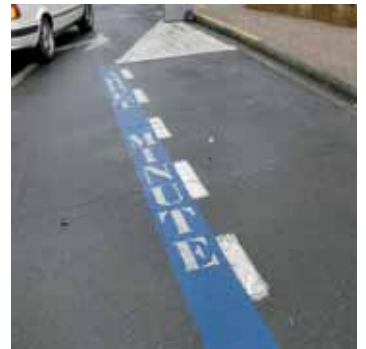
Des arrêts minute jalonnent la rue.

du Gave. À l'issue des présentations, le débat s'est engagé sur ces différents points, permettant aux habitants d'échanger avec les conseillers sur le travail accompli depuis trois ans pour leur quartier, et celui à venir.