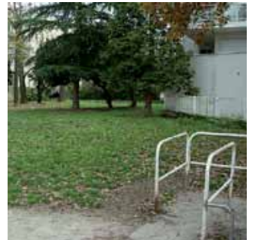
L'aménagement du square Chanoine Laborde est au cœur des propositions

questionnaire avec l'aide des services de la Ville. Les riverains du square ont ainsi pu, l'été dernier, émettre des propositions quant à l'aménagement de cet espace vert.