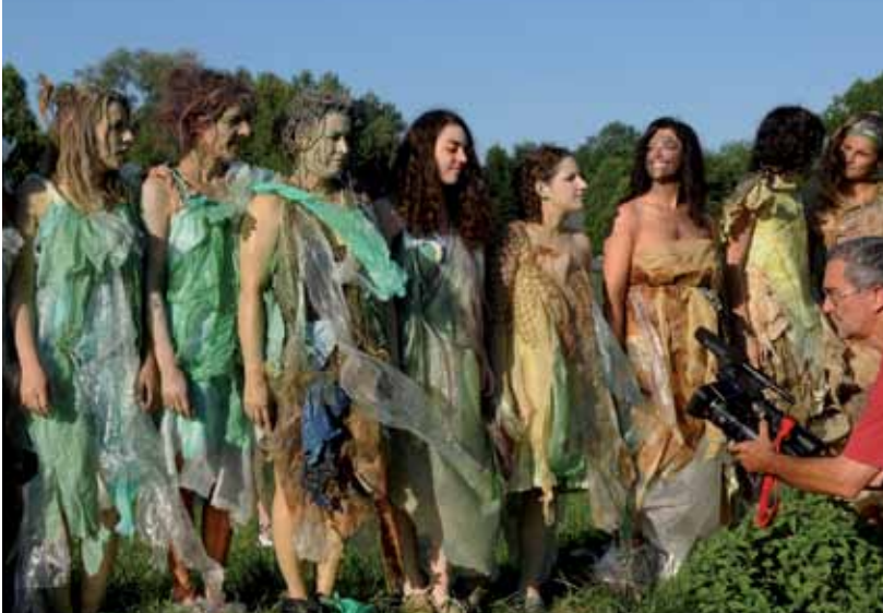
Histoire(s) de gave(s) associait déjà mémoire collective et participation des habitants.

La Compagnie « le lieu » invite les aînés palois à participer à la création de leur nouveau spectacle, Histoire(s) de printemps.