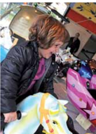
Des enfants enchantés.

Peuplé d'espèces rares comme le cèdre de l'Atlas et celui du Liban, le parc Lawrance est l'un des plus beaux poumons verts de Pau. Cet espace de tranquillité, proche du cœur de ville, a aussi la réputation d'être un véritable petit paradis pour les enfants. Au-delà des deux aires de jeux mises en place, le manège constitue l'attraction favorite des bambins. Il faut dire que l'ancien mo-