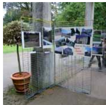
Une exposition itinérante relate l'histoire du quartier

partenariat de même nature avec le collège Sainte-Ursule. Parallèlement, le groupe de travail poursuit son étude d'opportunité sur la mise en place d'itinéraires de cheminements piétonniers et cyclables dans le quartier Pau Sud.