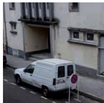
Les problématiques de stationnement au cœur des débats

gétique, ainsi qu'au Projet Éducatif Local qui va être élaboré dans le cadre de l'adhésion de la Ville de Pau à la charte des Villes Éducatrices. Ce projet participatif, mené à l'échelle des six quartiers, permettra aux habitants de partager leur expérience en terme d'éducation tout au long de la vie.